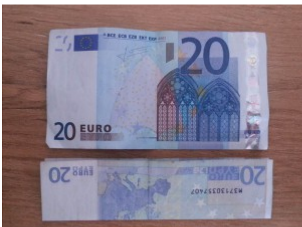
Hase aus Geldschein falten – Schritt 1

Jedes Foto zeigt jeweils zwei Teilschritte, die nacheinander zu falten sind.