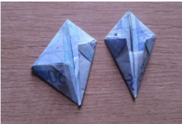
Hase aus Geldschein falten – Schritt 5

In diesem Schritt werden die beiden untere äußeren Ecken zur Mitte gefaltet. Dabei ist zu beachten, daß je nach Geldschein (die unterschiedliche Seitenverhältnisse haben) an den äußeren Ecken Überlappungen entstehen.