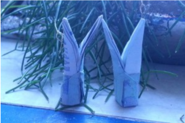
Zwei Hasen aus Geldscheinen

Sie nun eine Spitze in die Tasche der anderen Spitze. Je besser Sie den Hasen um den Stift gewickelt haben, desto leichter läßt sich dieser Faltschritt nachfalten.