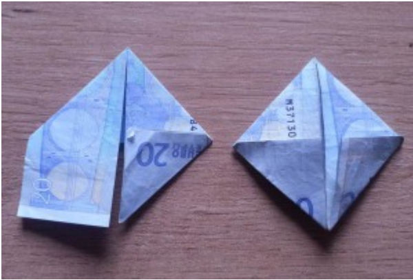
Hase aus Geldschein falten – Schritt 4

In diesem Schritt werden die beiden untere äußeren Ecken zur Mitte gefaltet. Dabei ist zu beachten, daß je nach Geldschein (die unterschiedliche Seitenverhältnisse haben) an den äußeren Ecken Überlappungen entstehen.