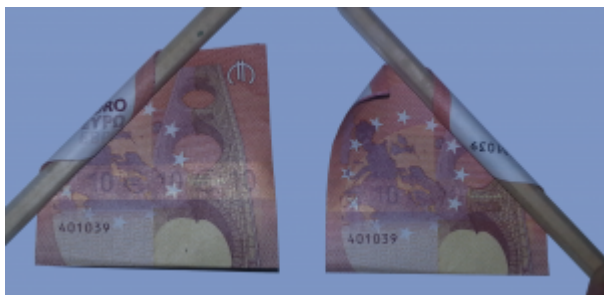
Rose aus Geldscheinen falten: Schritt 6

Nehmen Sie einen weiteren Geldschein. Legen und falten Sie ihn erneut wie bei dem ersten Schein.