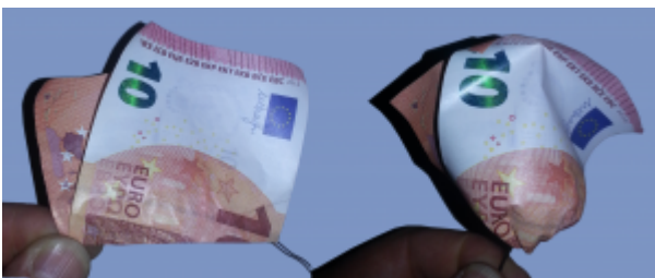
Rose aus Geldscheinen falten: Schritt 8

Falten Sie nun den vorderen Teil schräg nach hinten, so wie auf dem Foto abgebildet. Der Winkel muß nicht exakt stimmen, es reicht, wenn er ungefähr stimmt.