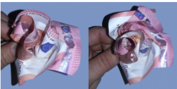
Rose aus Geldscheinen falten: Schritt 9

Damit ist ein Rosenblatt fertig. Wiederholen Sie diese Schritte mit drei weiteren Geldscheinen.