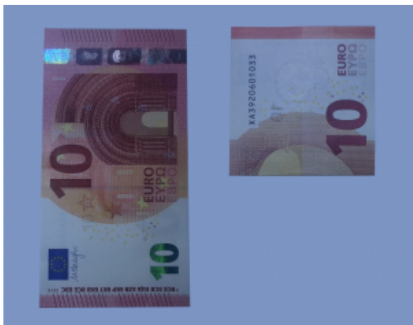
Rose aus Geldscheinen falten: Schritt 1

Diesen Teil der Rose können Sie zur Seite legen.