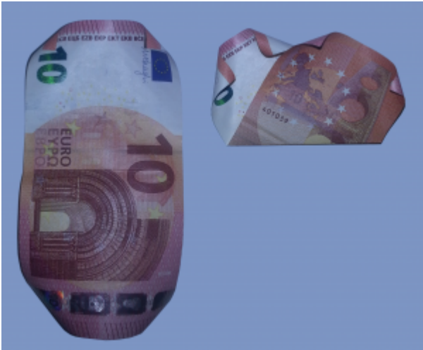
Rose aus Geldscheinen falten: Schritt 7