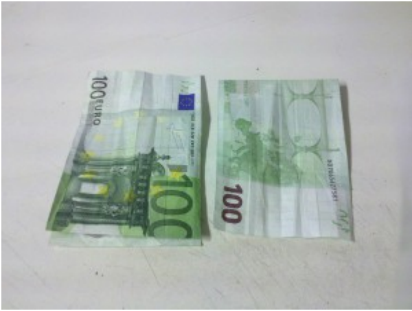
Sonne aus Geldschein falten – Schritt 2

Nun den Euroschein wieder nach hinten falten und wieder nach vorne klappen.