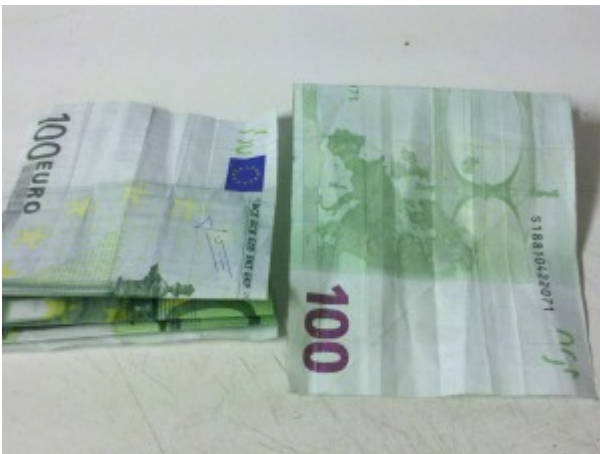
Sonne aus Geldschein falten – Schritt 3

Nun den Euroschein wieder nach hinten falten und wieder nach vorne klappen.