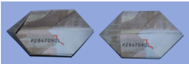
Fliege aus Geldschein falten: Schritt 6

Drücken Sie das nun entstandene Dreieck platt und drehen den Geldschein um.