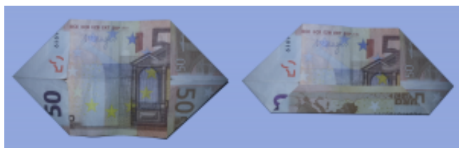
Fliege aus Geldschein falten: Schritt 2

Falten Sie nun den Schein in der Mitte nach hinten, so daß die vordere Kante mit der hinteren Kante bündig ist.