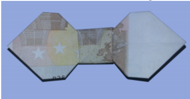
Eine Geldschein-Fliege aus 50 Euro gefaltet

Nun drücken Sie den Geldschein noch platt und fertig ist die Geld-Fliege!