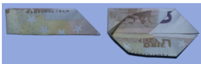
Fliege aus Geldschein falten: Schritt 4

Falten Sie anschließend die linke Spitze des Geldscheins auf die rechte Spitze.