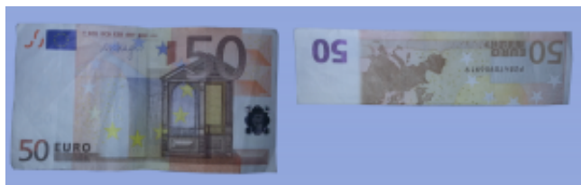
Fliege aus Geldschein falten: Schritt 1

Legen Sie den Geldschein quer vor sich hin.