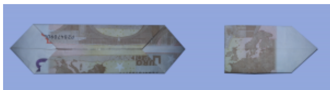
Fliege aus Geldschein falten: Schritt 3

Falten Sie die vordere Kante zur Mittelfalz.