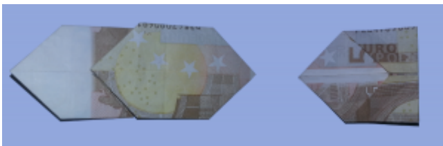
Fliege aus Geldschein falten: Schritt 8

Drehen Sie den Geldschein und falten Sie erneut den rechten Teil nach links um.