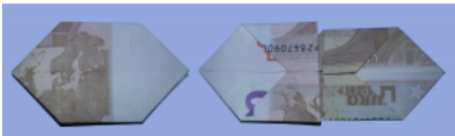
Fliege aus Geldschein falten: Schritt 7

Heben Sie wie im vorherigen Schritt die linke vordere Ecke an und klappen Sie diese zur Mitte. Drücken Sie das Geldobjekt flach.