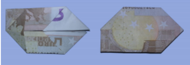
Fliege aus Geldschein falten: Schritt 5

Heben Sie die linke hintere Ecke des Geldscheines an, drücken Sie dabei aber den hinteren Teil fest, so daß sich ein Objekt ergibt, wie auf dem Foto abgebildet.