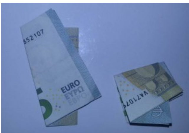
Kleeblatt aus Geld falten - Schritt 2

Falten Sie dann die rechte Kante des Geldscheins bündig auf die linke Kante.