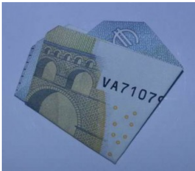
Kleeblatt aus Geld falten - Schritt 3

Drehen Sie nun das gefaltete Geld und knicken Sie die Spitzen nach hinten um. Nach diesem Zwischenschritt ist das einfache Geld-Herz fertig.