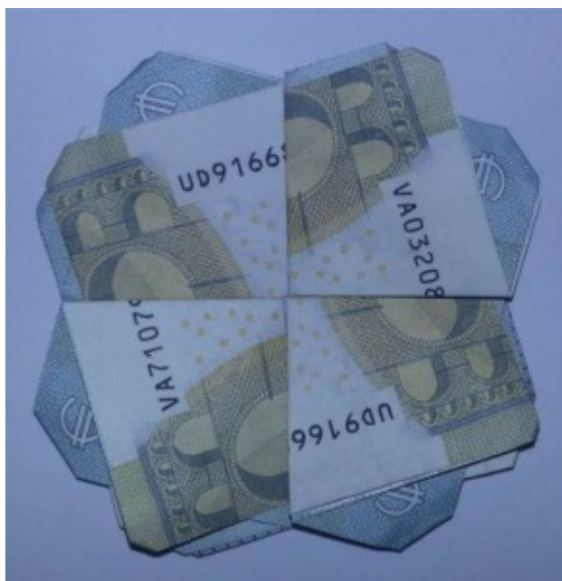
Kleeblatt aus Geld

Wiederholen Sie diese letzten drei Schritte mit drei weiteren Geldscheinen.