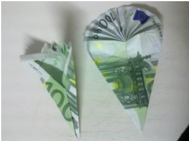
Schultüte aus einem Geldschein falten – Schritt

Lassen Sie oben einen Rand von nicht mehr als 3-4mm und falten Sie den Schein wieder nach oben, anschließend wieder nach unten... usw. bis der restliche Schein zu einer Ziehharmonika gefaltet ist.