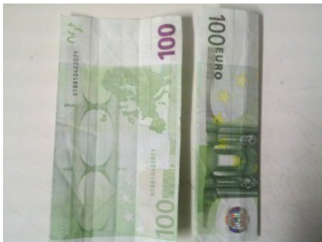
Schultüte aus einem Geldschein falten – Schritt 1 Falten