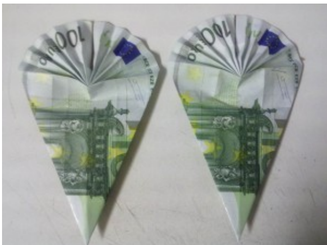
Origami: Schultüte aus Geldschein gefaltet. So sehen

Drehen Sie den Schein um, falten Sie ihn auf und drücken ihn leicht platt.