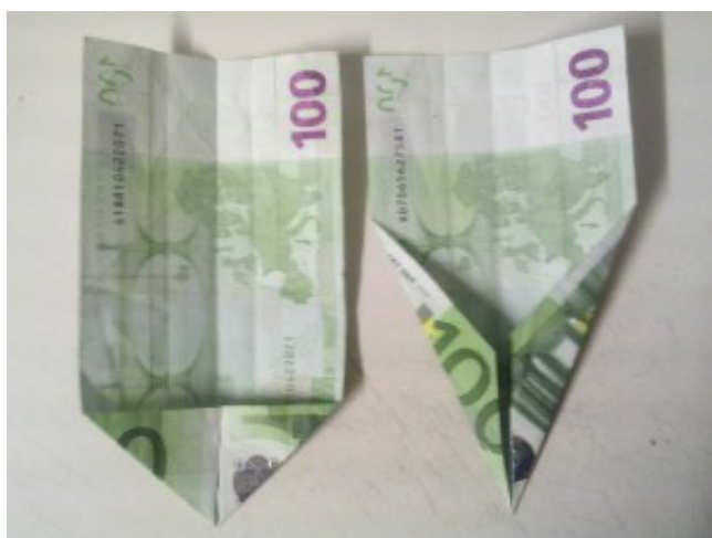
Schultüte aus einem Geldschein falten – Schritt

2 Entfalten Sie den Schein wieder und falten Sie die Ecken zur Mitte hin.