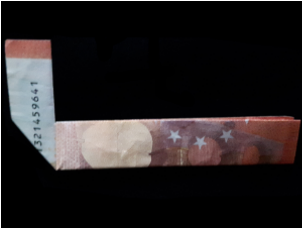
Zahl 4 aus einem Geldschein falten – Schritt 4