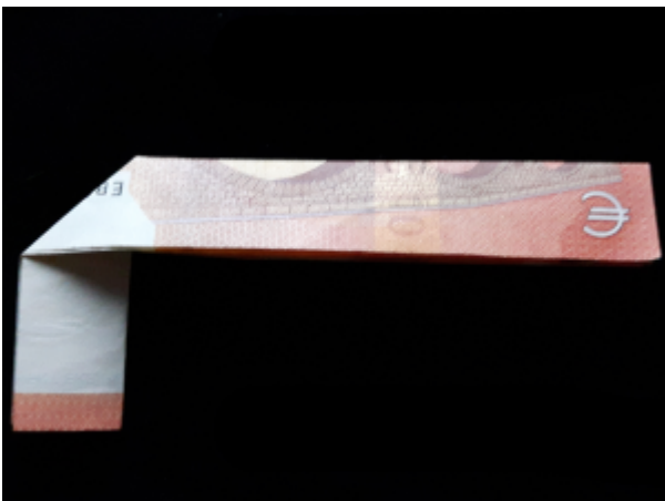
Zahl 4 aus einem Geldschein falten – Schritt 5

Schätzen Sie grob \frac{1}{3} ab und falten an dieser Stelle die linke Seite des Geldscheins rechtwinklig nach hinten. Drücken Sie die Falz flach und ziehen Sie sie mit dem Fingernagel nach.