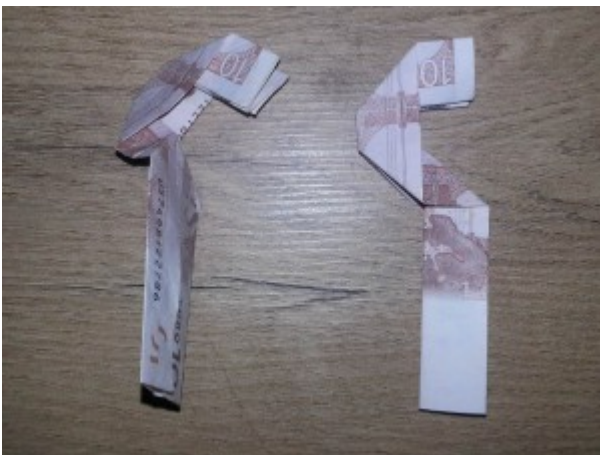
Zahl 5 aus einem Geldschein falten – Schritt 8

Wiederum wird der untere Teil des Geldscheines einmal nach vorne und einmal nach hinten gefaltet.