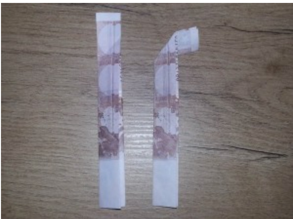
Zahl 5 aus einem Geldschein falten – Schritt 3

Oben wird der Schein nun in einem rechten Winkel nach rechts umgeknickt, wie auf dem Foto abgebildet.