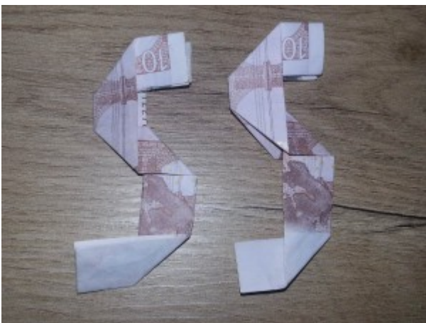
Zahl 5 aus einem Geldschein falten – Schritt 9

Und nochmals wird der Mittelfalz wieder entgegen seiner Faltung nach innen gefaltet.