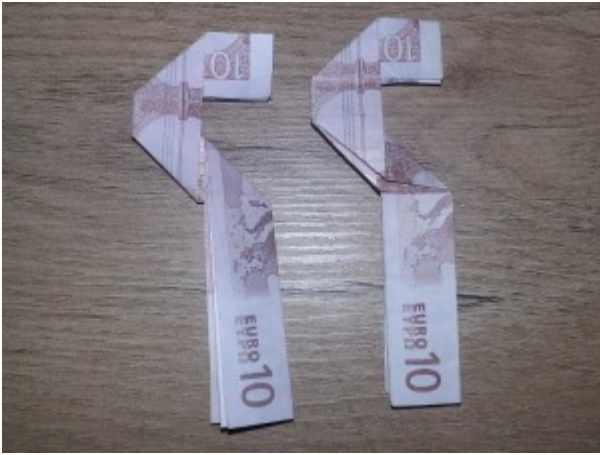
Zahl 5 aus einem Geldschein falten – Schritt 7

Wiederum wird der untere Teil des Geldscheines einmal nach vorne und einmal nach hinten gefaltet.