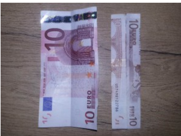
Zahl 5 aus einem Geldschein falten – Schritt 1

Auf jedem Foto sehen Sie zwei kleine Teilschritte. Sie benötigen aber nur eine Banknote.