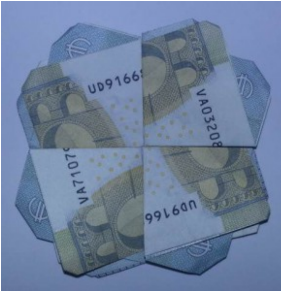
Kleeblatt aus Geld

Arrangieren Sie die vier Geldscheine im Kreis und fertig ist das Kleeblatt.