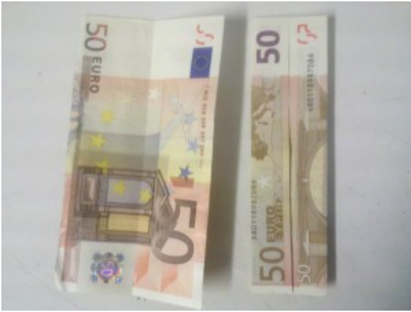
Zahl 3 aus einem Geldschein falten – Schritt 2

Diese Faltung wird wieder rückgängig gemacht und anschließend die Seiten zum eben gefalteten Mittelknick gefaltet.