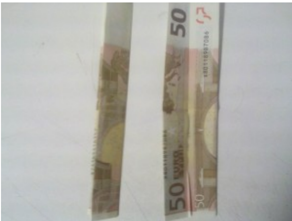
Zahl 3 aus einem Geldschein falten – Schritt 3

Diese Faltung wird wieder rückgängig gemacht und anschließend die Seiten zum eben gefalteten Mittelknick gefaltet.