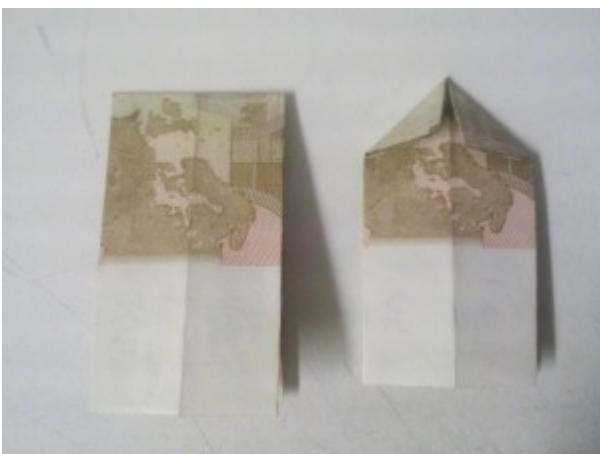
Zahl 3 aus einem Geldschein falten – Schritt 4

Der Geldschein wird wiederum längs zusammengefaltet, die Kanten mit dem Fingernagel nachgezogen und dann wieder entfaltet.