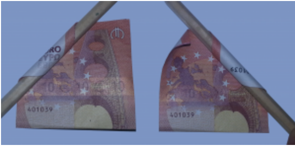
Rose aus Geldscheinen falten: Schritt 6

Nehmen Sie erneut den Stift zur Hand und rollen Sie die hinteren Ecken um den Stift in die Mitte.