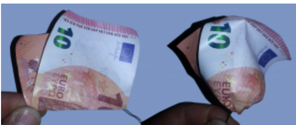
Rose aus Geldscheinen falten: Schritt 8

Öffnen Sie den Geldschein. Falten Sie nun den vorderen Teil schräg nach hinten, so wie auf dem Foto abgebildet. Der Winkel muß nicht exakt stimmen, es reicht, wenn er ungefähr stimmt.