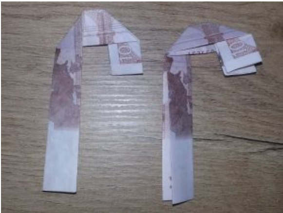
Zahl 5 aus einem Geldschein falten – Schritt 5

Die Falze mit dem Fingernagel nachziehen.