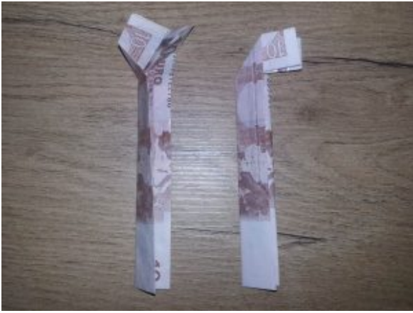
Zahl 5 aus einem Geldschein falten – Schritt 4

Nun kommt ein kleiner kniffliger Teil, der etwas mehr Fingerfertigkeit erfordert: