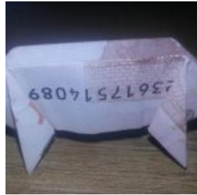
Schwein aus Geldscheinen

Wenn Sie weitere Anleitungen wünschen oder selbst welche gefunden oder erstellt haben, dann hinterlassen Sie gerne einen Kommentar!